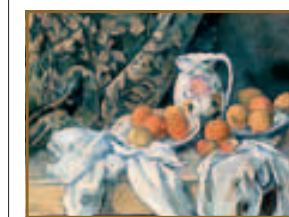
«Натюрморт с драпировкой», 1889 год

Династия аль-Тани правит Катаром более 130 лет. Около полувека назад здесь были обнаружены огромные запасы нефти и газа, что вмиг сделало Катар одним из богатейших регионов мира. Благодаря экспорту углеводородов в этой маленькой стране зафиксирован самый большой ВВП на душу населения. Шейх Хамад бин Халифа аль-Тани в 1995 году, пока отец находился в Швейцарии, при поддержке членов семьи захватил власть. Заслуга действующего правителя, по мнению экспертов, в четкой стратегии развития страны, создании успешного имиджа государства. Сейчас в Катаре появились конституция и премьер-министр, а женщины получили право голоса на парламентских выборах. Кстати, именно эмир Катара основал новостной канал «Аль-Джазира». Огромное внимание власти арабского государства уделяют культуре.